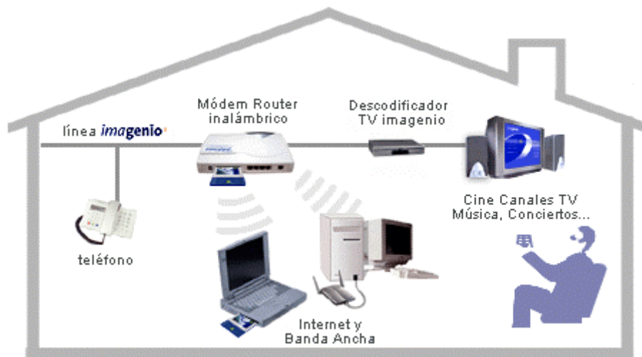
Figura 1 - Equipamiento de Usuario

La instalación típica se representa en la siguiente figura: